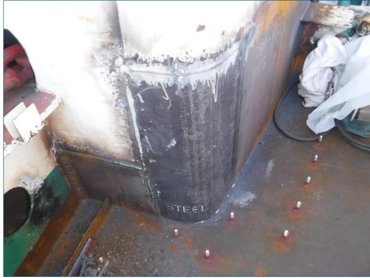
ガス溶接による新しい鋼板の取付け②