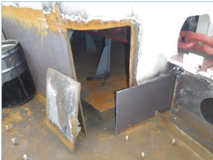
ガス溶接による新しい鋼板の取付け①