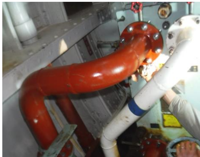
交換された新しい空調用冷却器パイプ（出口海水管）