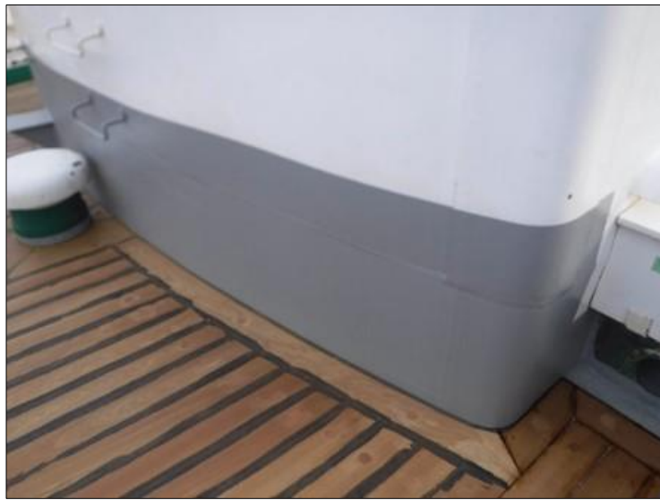
錆止め塗料（2回目）塗装