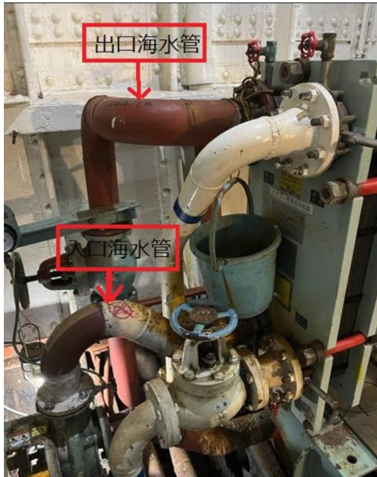
交換前の空調用冷却器パイプ（バケツは漏水受け）