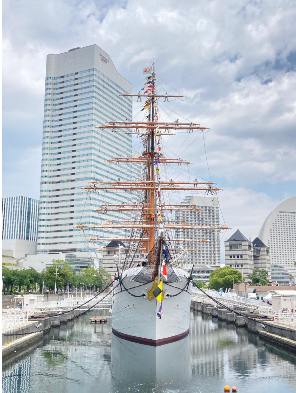
2024（令和6）年6月2日 登檣礼(とうしょうらい)