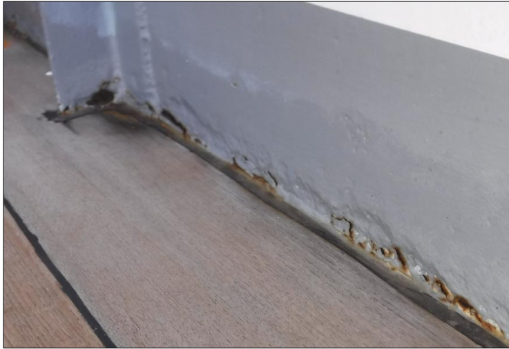
腐食により破孔が生じたフード側壁