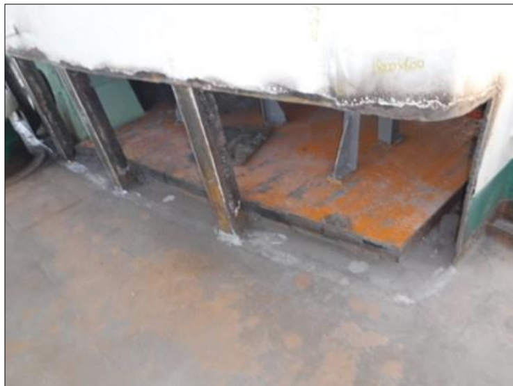
フード側壁基部（腐食部）ガス切断